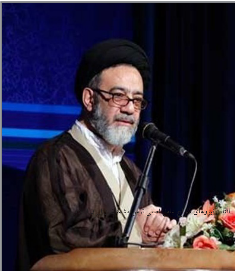
اقتدار نیروهای بسیج عامل اصلی ترس دشمنان از ایران است

دوران خدمت به خصوص در دوران آموزش، ایمان خود را قوی و برای انجام فرایض دینی تلاش کنید، چرا که هر قدر ایمان شما تقویت شود موفقیت بیشتری به دست خواهید آورد. به نقل از دفتر نماینده ولی فقیه در آذربایجان شرقی، وی افزود: